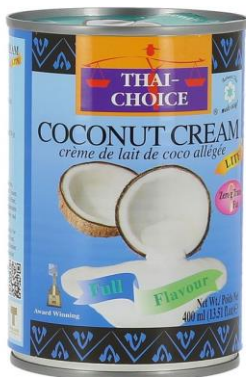
Kookoskroom, THAI CHOICE, 400 ml