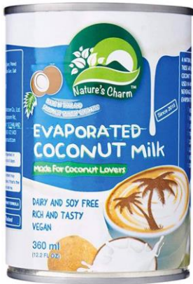
Kondenseeritud kookose ekstrakt, NATURES CHARM, 360 ml