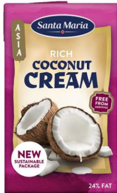
Kookoskroom, SANTA MARIA, 250 ml